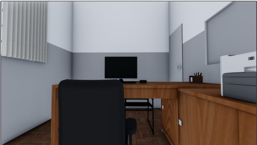
PERSPECTIVA 03 SEM ESCALA