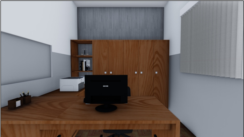
PERSPECTIVA 01 SEM ESCALA