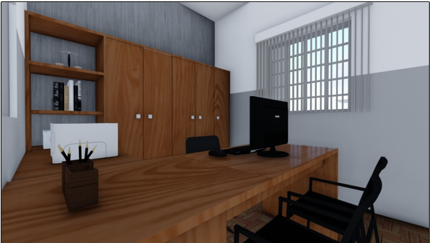
PERSPECTIVA 02 SEM ESCALA